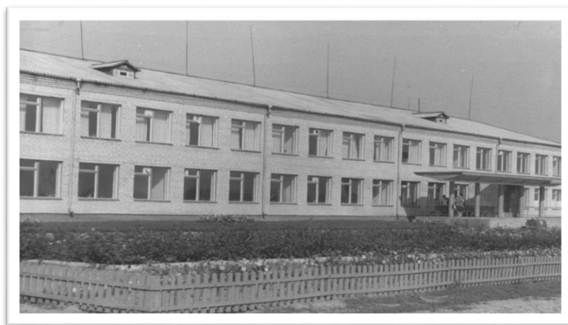
Бранівська середня школа ( 1976 рік)