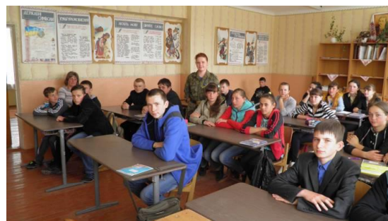
Захід, присвячений річниці Майдану