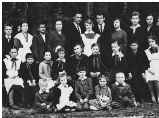
Кращі учні школи (1964-65 р.р.)